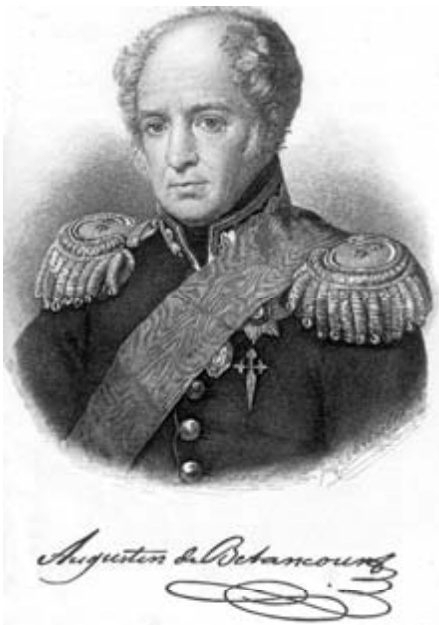
Fig. 1. Agustín de Betancourt.