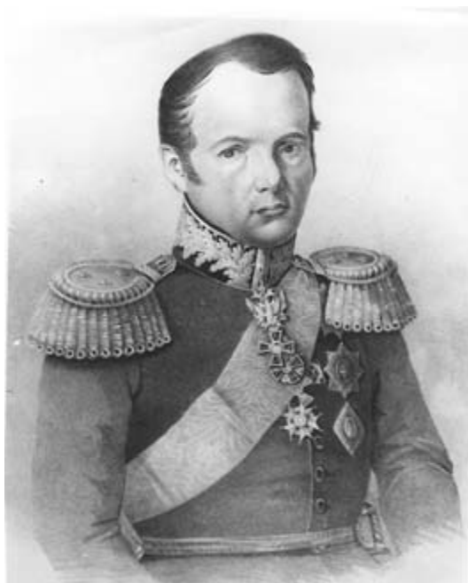
Fig. 4. Pierre Dominique Bazaine.