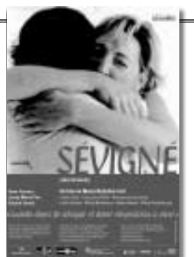
CARTEL DE LA PELÍCULA.