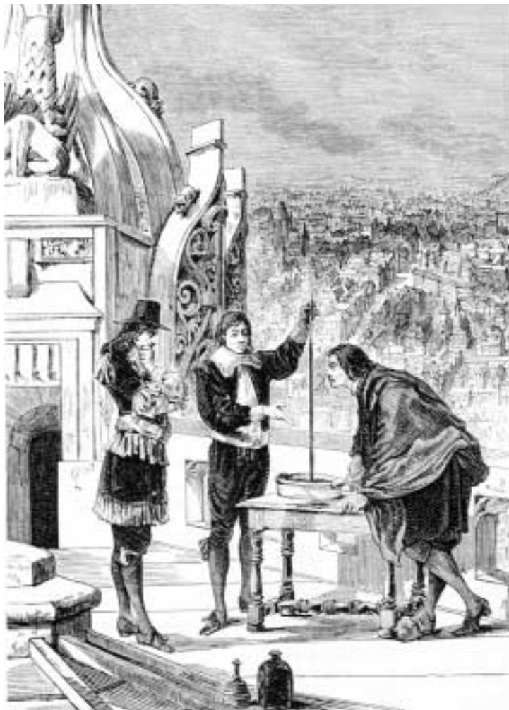
PASCAL REPRODUCIENDO SU EXPERIMENTO BAROMÉTRICO EN LA TORRE DE SAINT-JAQUES DE LA BOUCHERIE EN PARÍS.

DIGITAL HUMBOLDT, SOBRE EXPEDICIONES CIENTÍFICAS A CANARIAS EN LOS SIGLOS XVIII Y XIX. ESTE PROYECTO HA PASADO AHORA A FORMAR PARTE DE UN NUEVO PROYECTO DIGITAL MÁS AMPLIO SOBRE DOCUMENTACIÓN CIENTÍFICA, REALIZADO TAMBIÉN CON EL MAX PLANCK, UNO DE CUYOS FINES PRINCIPALES ES LA DIDÁCTICA Y LA DIVULGACIÓN CIENTÍFICA. EN ESTE SENTIDO, QUEREMOS OFRECER A LOS LECTORES, CON PERIODICIDAD QUINCENAL, UNA SERIE DE ARTÍCULOS BAJO EL TÍTULO GENÉRICO DE “VIAJEROS CIENTÍFICOS EN CANARIAS”, EN LOS QUE EXPONER ALGUNOS DE LOS TEMAS DE NUESTRA INVESTIGACIÓN Y DOCUMENTACIÓN, FUNDAMENTO DE NUESTRO TRABAJO.