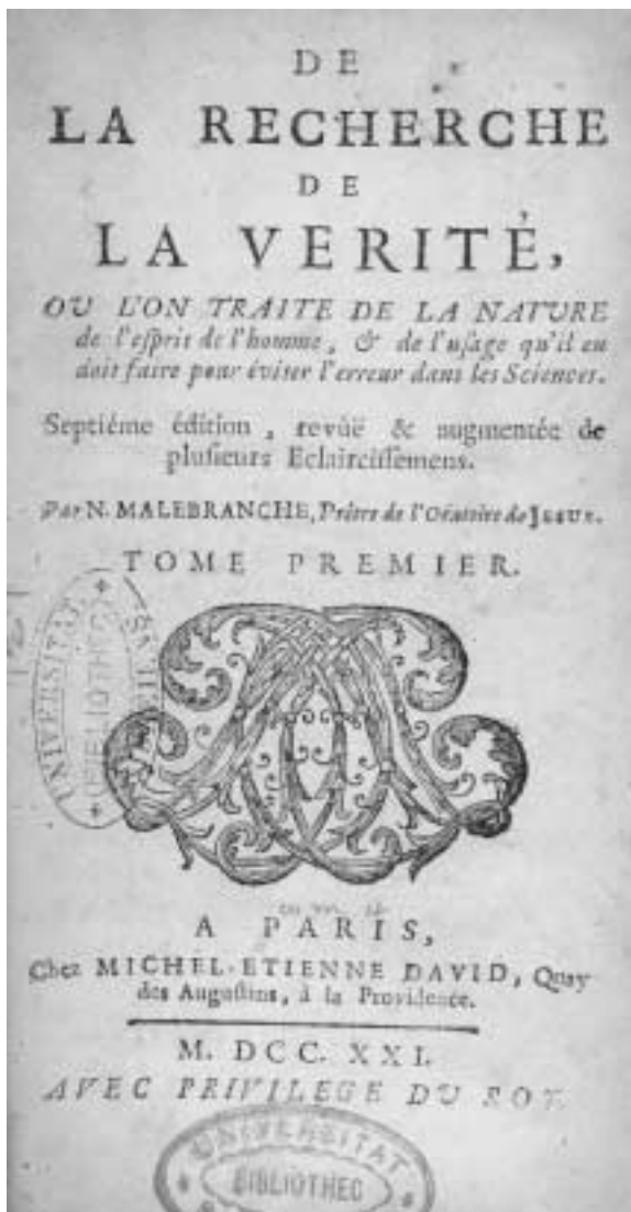
PORTADA DEL LIBRO DE LA BÚSQUEDA DE LA VERDAD. PARÍS, 1721.

tico de lo trascendente que será definitiva para el progreso de las ciencias y de las libertades humanas. El estudio de las nuevas ciencias –física, matemáticas, ciencias naturales– es una tarea indisociable de esa manera de entender las cosas, y su perfeccionamiento forma parte de ese ambicioso proyecto apologético según Malebranche.