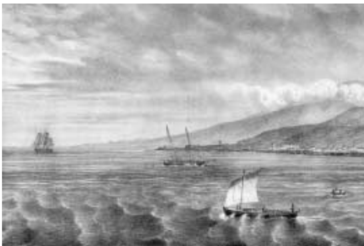
"BARCOS DE PESCA CERCA DE SANTA CRUZ". DE LAS MISCELÁNEAS CANARIAS (IMAGEN P. HUMBOLDT).

FUNDACIÓN CANARIA OROTAVA DE HISTORIA DE LA CIENCIA - HTTP://NTLEDUCA.RCANARIA.ES/FUNDORO/ - PROYECTO HUMBOLDT: HTTP://HUMBOLDT.MPIWG-BERLIN.MPG.DE/