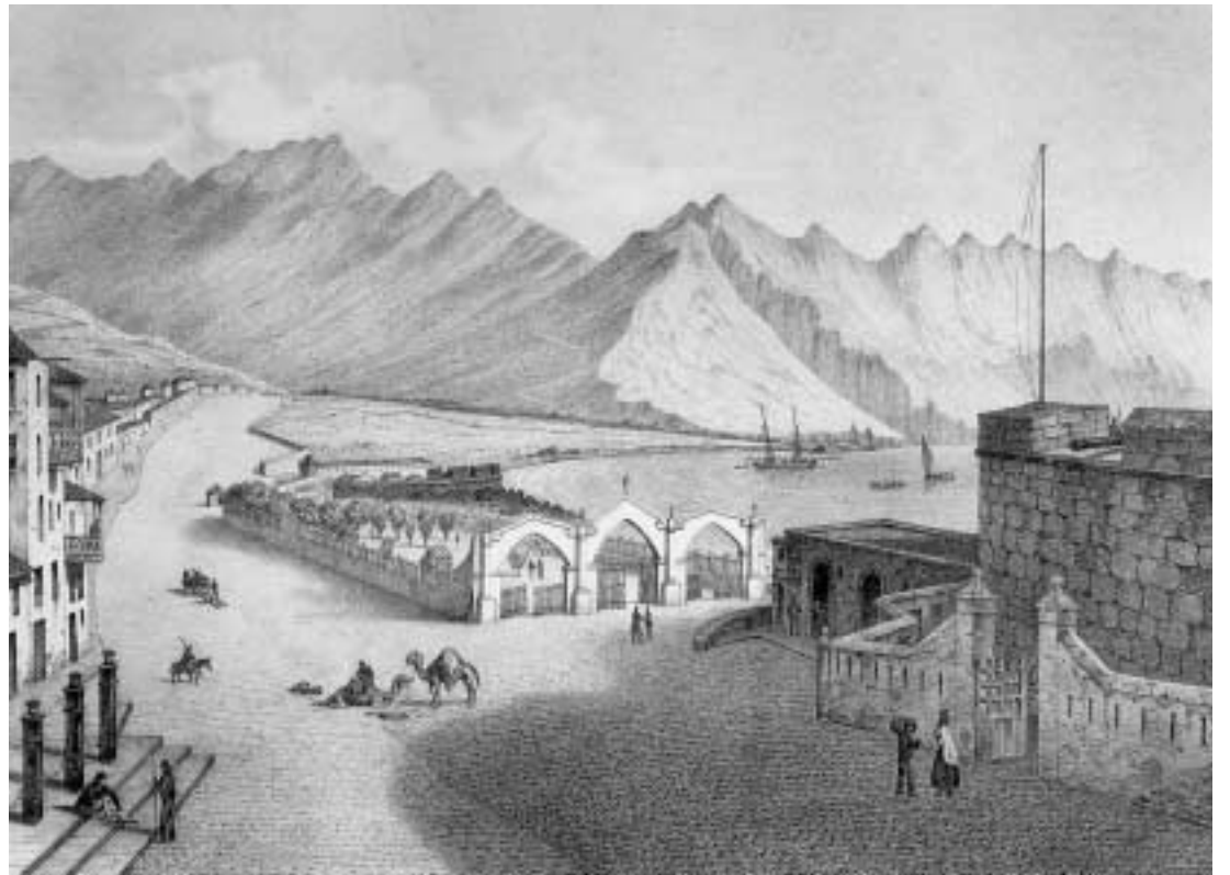
RADA, ALAMEDA Y DROMEDARIOS EN SANTA CRUZ DE TENERIFE.