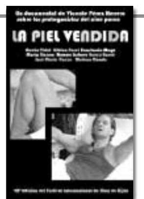
CARTEL DE LA PELÍCULA.