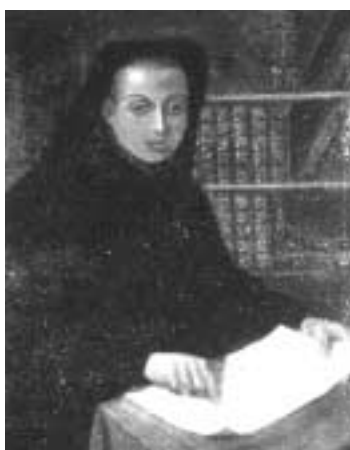
RETRATO DEL PADRE FEUILLÉE.

EL ASTRÓNOMO Y RELIGIOSO LOUIS FEUILLÉE (1660-1732) SE FORMÓ Y AFIANZÓ SU CARRERA CIENTÍFICA EN VARIOS CONVENTOS FRANCISCANOS DEL SUR DE FRANCIA