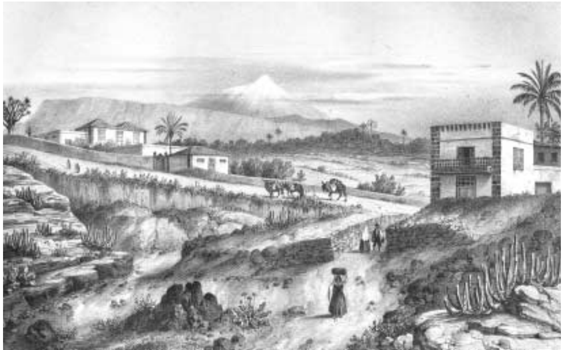
“VISTA DE UNA PARTE DEL VALLE DE LA OROTAVA”. DE LAS MISCELÁNEAS CANARIAS . 1839.